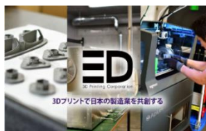
3Dプリンティング技術 (横浜市)