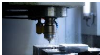
精密部品加工技術 (大阪市)