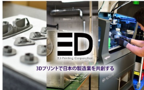
3Dプリンティング技術 システム開発&SI技術