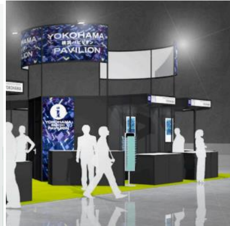
「横浜パビリオン」 【ブース番号 DJ14】

【展示会の概要】（ET&IoT2021 公式サイト） https://www.jasa.or.jp/expo/