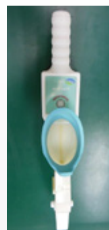
ポータブル尿流量計